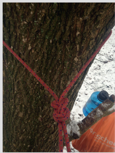
2 Spannen an der Leine