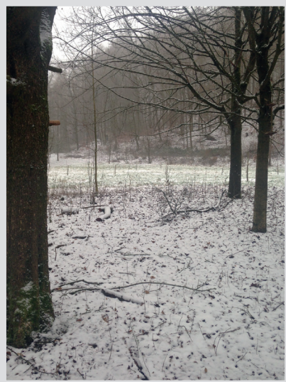
1 Platz finden