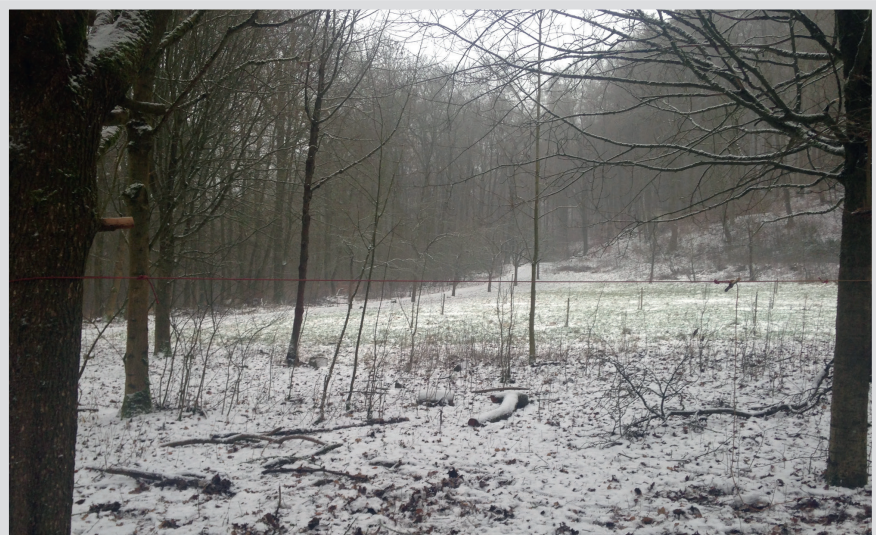
4 Gespannte Leine