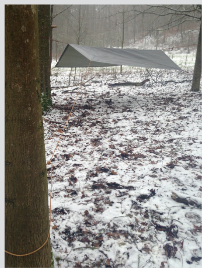
7 Ecken abspannen