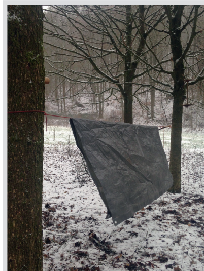
5 Plane über gespannte Leine