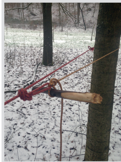
3 Spannen an der Leine