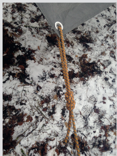
6 Befestigung in den Ösen an der Plane